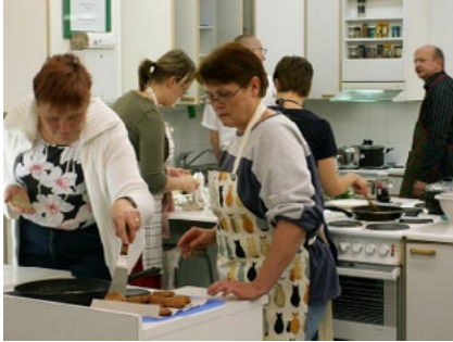
Escuela de adultos