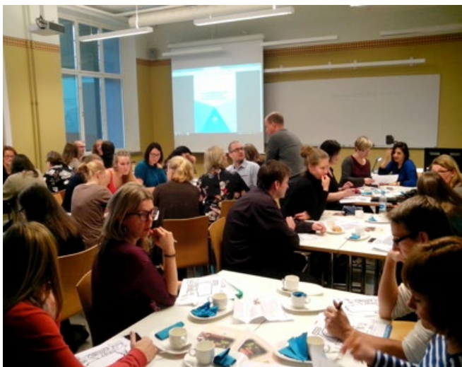
Jornada de formación de profesorado

En Finlandia se vive actualmente una fase de expansión de la enseñanza del español promovido, en gran medida, por un clima favorable al fomento del aprendizaje de lenguas extranjeras que tiene su reflejo en la toma de decisiones en materia de política educativa. El objetivo propuesto de fomento de estancias en el extranjero por parte de los estudiantes (mayor internacionalización), añadido al gusto de los finlandeses por lo español, son factores que contribuyen a un incremento de la demanda de nuestro idioma entre los finlandeses. España sigue siendo un destino de primer orden tanto en programas europeos -Erasmus- como a nivel particular.