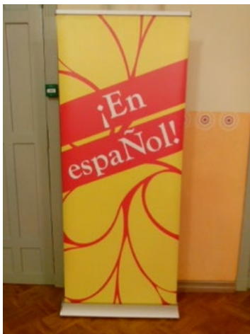
¡En espaÑol!, portal de encuentro para profesores de español en Finlandia.

Las actividades de formación se programan y diseñan en colaboración con las asociaciones de profesores de español y el Instituto Cervantes de Estocolmo. La formación responde a las necesidades específicas del profesorado, de acuerdo con los respectivos planes curriculares y la necesaria actualización metodológica y científica. Desde la Consejería se organizan y apoyan, en sus diversas modalidades, dos acciones al año, en las que participan profesores de enseñanza primaria, secundaria, bachillerato y universidad.