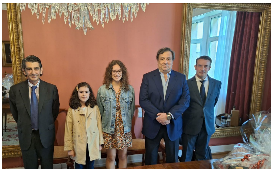
Remise de prix du Concours Picasso organisé par l'ALCE au Luxembourg