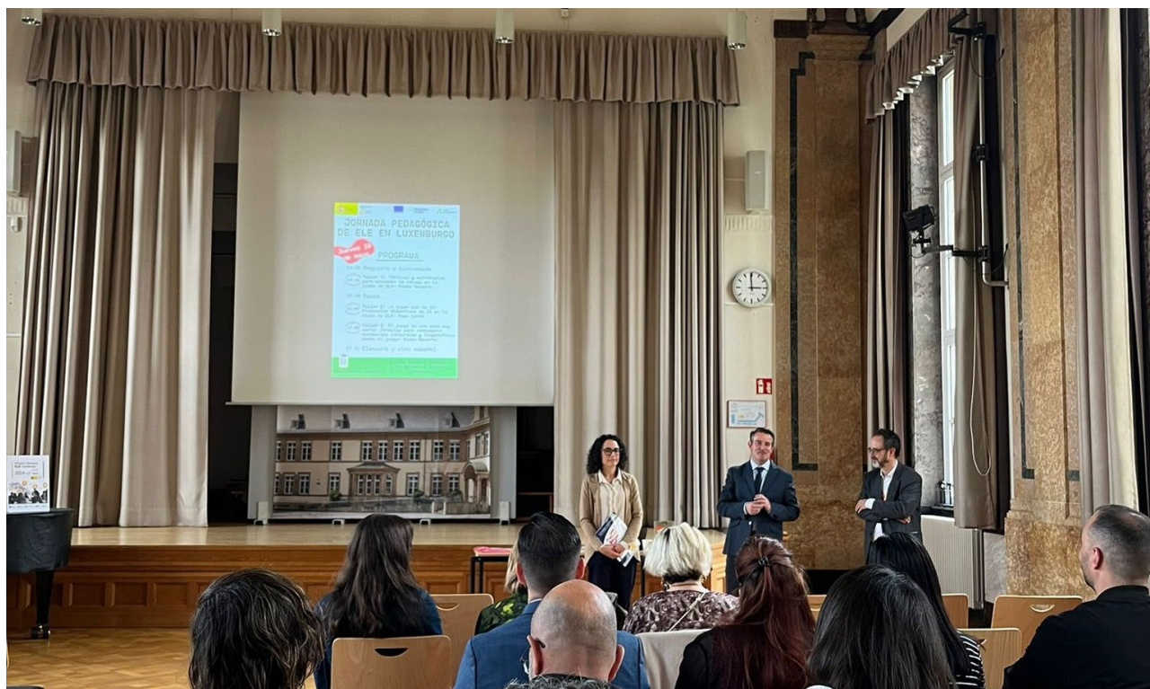
Séance de formation au Lycée Robert Schuman pour les enseignants d'espagnol

3 Certains enseignants appartenant à l'Action Éducative Extérieure (AEE) ont également participé aux activités destinées aux professeurs d'espagnol locaux.