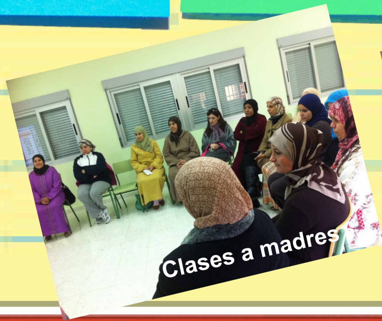
Clases a madres

Centro abierto a las familias , para conseguir que tengan mayores expectativas respecto a sus hijos.