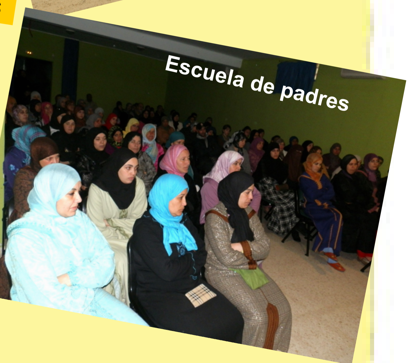
Escuela de padres