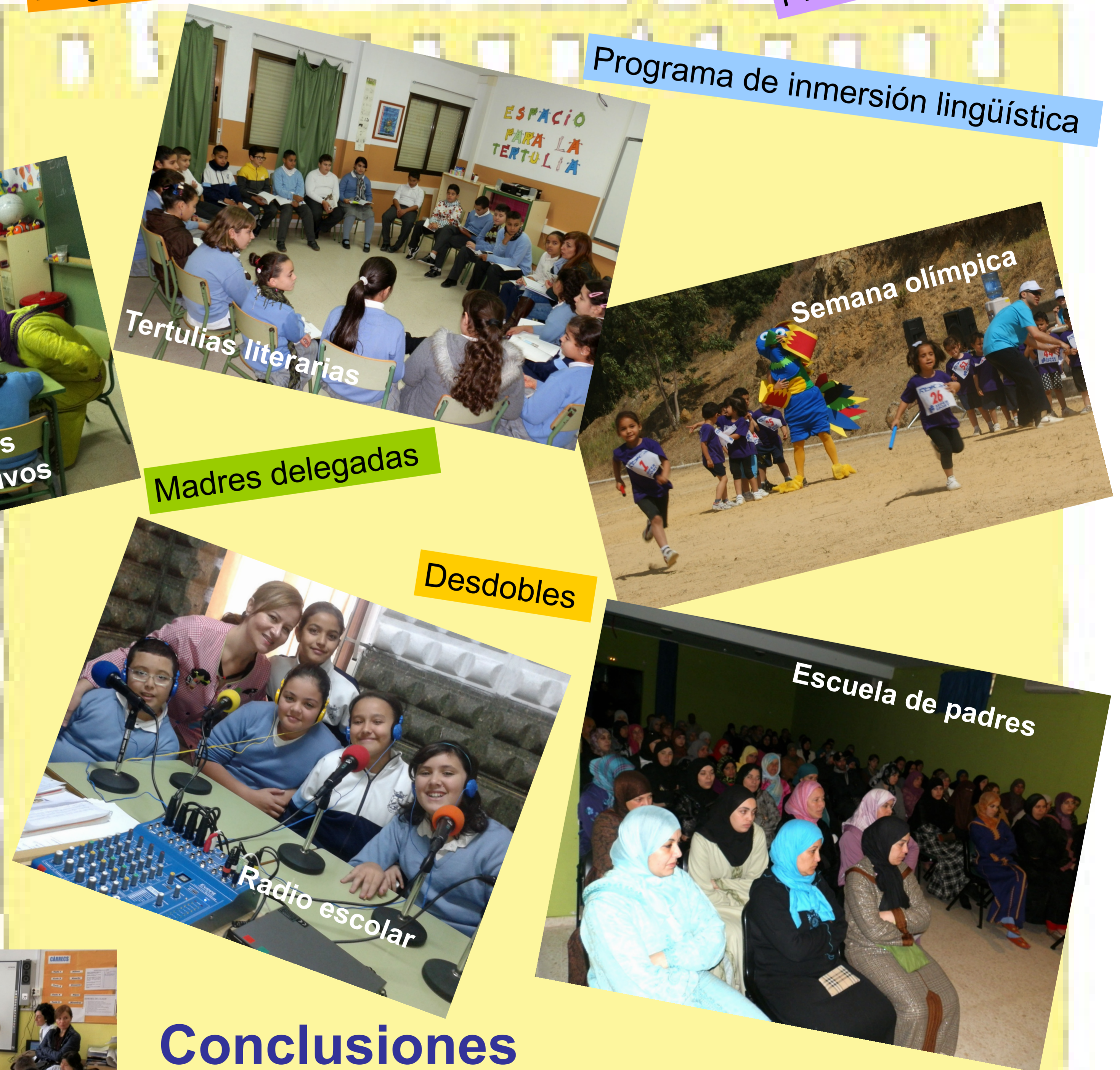
Programa de acogida