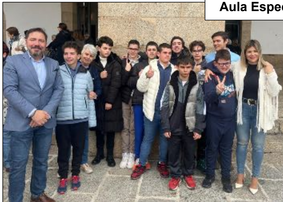
Aula Especializada TEA

Objetivo: favorecer la inclusión, la autonomía y la participación plena.