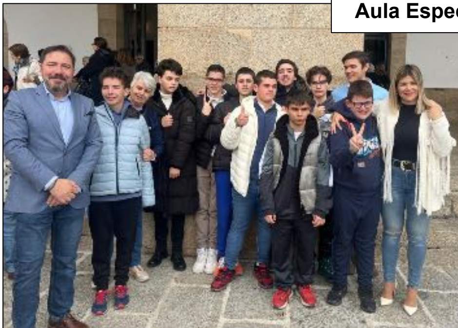
Aula Especializada TEA