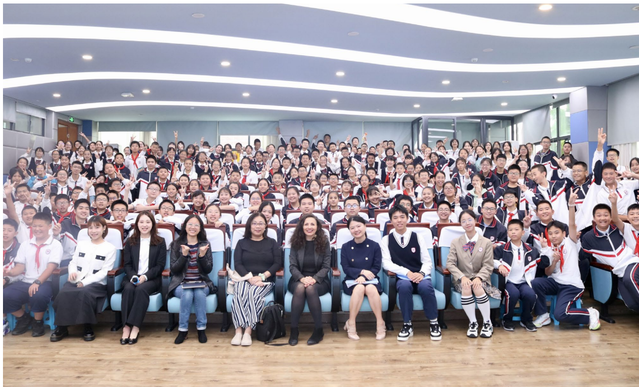
照片1 参观成都外国语学校

该项目自2007年在济南和北京推广以来，至今一直持续稳定增长。2015年，西安外国语学校加入该项目，2017年增加了上海市甘泉外国语中学。在2024年又新增了北京第二外国语学院成都附属中学，并且将有一名西班牙教师在该校任职。