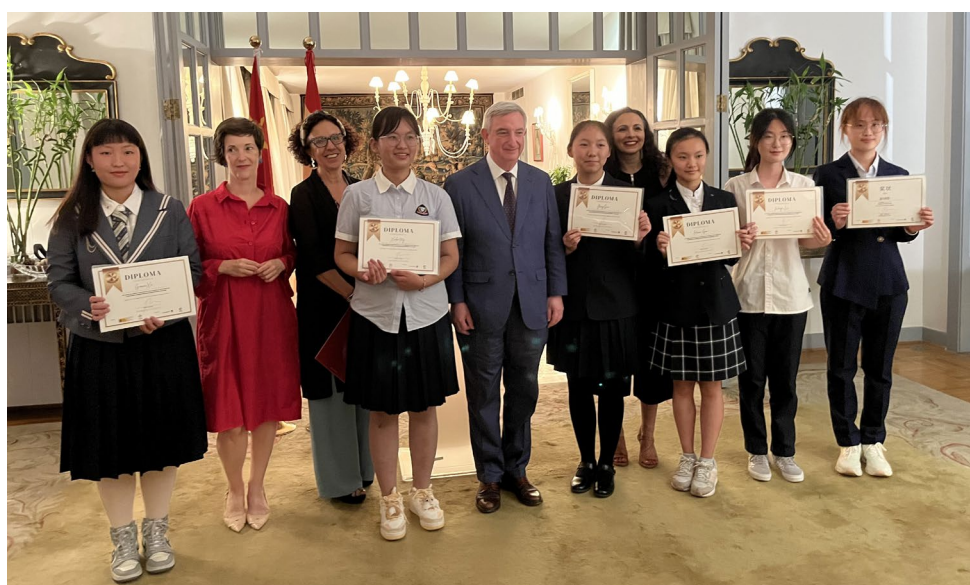
照片4 第一届西班牙语征文大赛获奖者合影

自2023年启动以来，该活动已吸引全国200余所学校的学生积极参与，学生们通过录制西班牙语阅读视频的形式展现学习成果。此项创新举措广受师生好评，相关活动内容通过教育处社交媒体平台获得广泛传播。