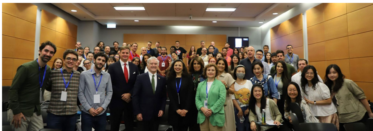
照片3 亚洲西班牙语教师培训-2023

2023年，教育处与香港大学合作，在香港成功举办了首届东亚地区西班牙语教师培训活动。本次活动吸引了90名教师参与，旨在提升教师专业素养、促进教学经验交流并构建区域教师网络。第二届培训活动的于2024年11月顺利举办。