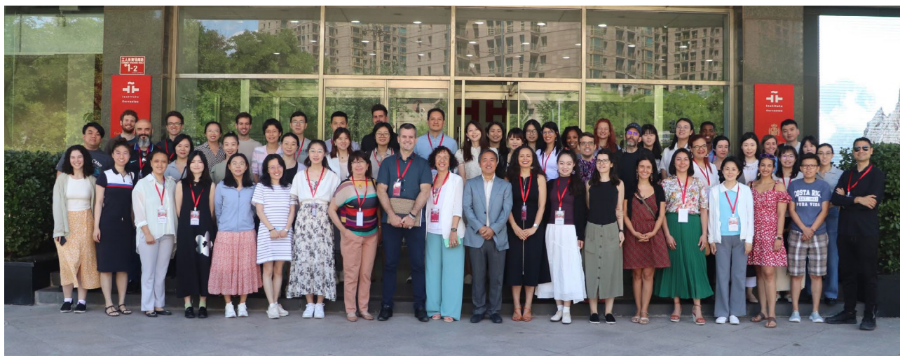
照片2 第十四届西班牙语教师培训-北京