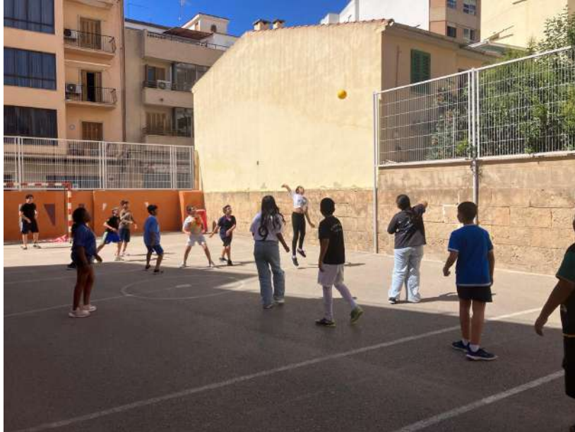
Multideporte colaborativo en familia