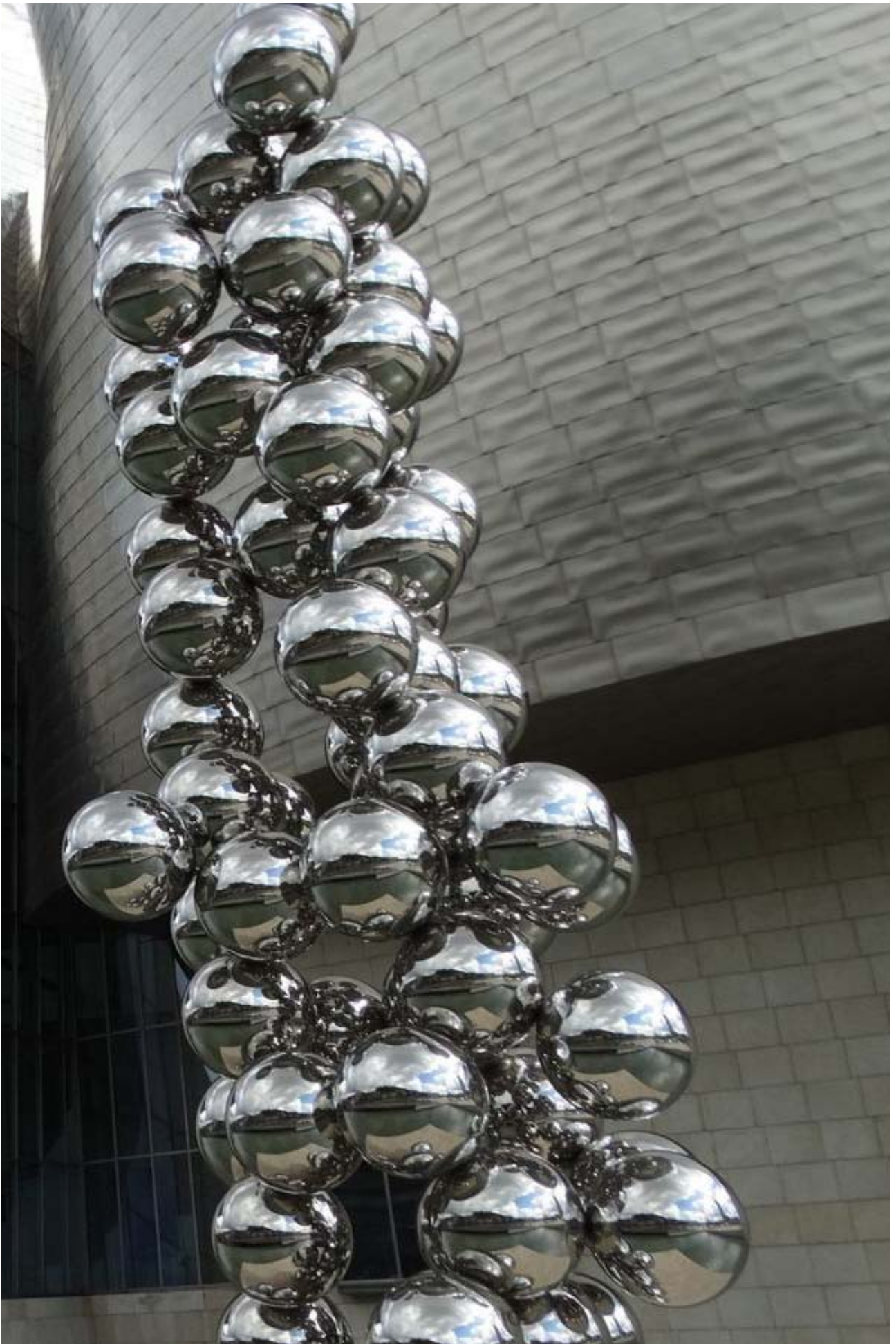
Anish Kapoor (2009). Tall tree and the eye . Museo Guggenheim, Bilbao.