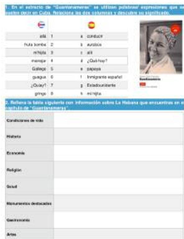
Figura 4 - Ejercicios de comprensión de "Guantanameras"

A través de una ficha de autoevaluación 1 y algunos trabajos de grupo 2 hemos conseguido verificar qué aprendizajes han hecho los alumnos. Respecto a la ficha de autoevaluación, hemos concluido que la gran parte de los alumnos consigue decir palabras/expresiones en la variante de español colombiano o cubano, reconocer el voseo y sus reglas gramaticales (Figura 6) y hablar sobre los temas culturales que uno encuentra en "Guantanameras". En los trabajos de grupo hay ya algún cuidado en buscar las variedades lingüísticas del país/ciudad que los alumnos han estudiado.