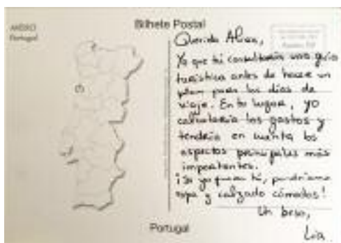
Figura 5 - Ejemplo de una postal creada por una de las alumnas

A través de una ficha de autoevaluación 1 y algunos trabajos de grupo 2 hemos conseguido verificar qué aprendizajes han hecho los alumnos. Respecto a la ficha de autoevaluación, hemos concluido que la gran parte de los alumnos consigue decir palabras/expresiones en la variante de español colombiano o cubano, reconocer el voseo y sus reglas gramaticales (Figura 6) y hablar sobre los temas culturales que uno encuentra en "Guantanameras". En los trabajos de grupo hay ya algún cuidado en buscar las variedades lingüísticas del país/ciudad que los alumnos han estudiado.