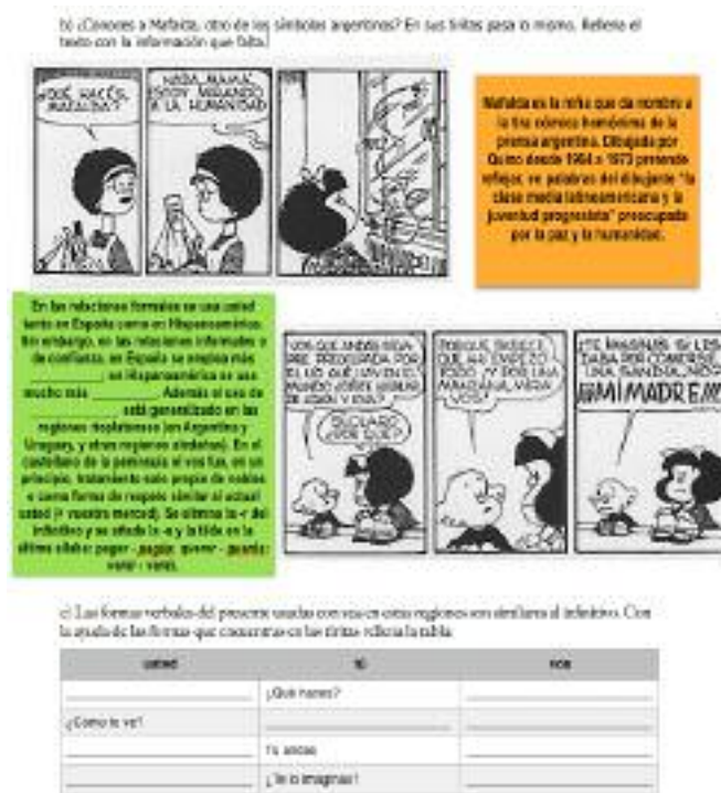
Figura 6 - Ejercicios sobre el voseo [Ejercicios de los autores]

Byram et al 2002; Cruz 2011), en una sociedad donde el lenguaje hipertexto prevalece con el uso de las herramientas Web 2.0. Asimismo, es necesario pasar de una enseñanza unisensorial a una enseñanza multisensorial, movida por las experiencias ofrecidas por los cinco sentidos (Arslan 2009).