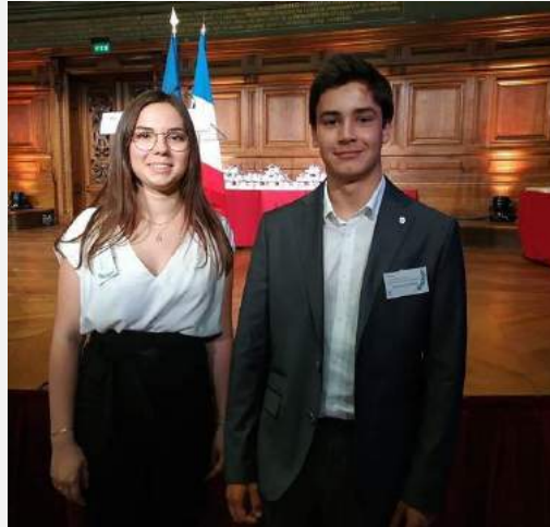
Élèves de la SIE de Toulouse, lauréats du concours général des lycées

visionnement de vidéos, des propositions de jeux en famille et parler l'espagnol à la maison. Au collège est mené un travail sur le brevet.