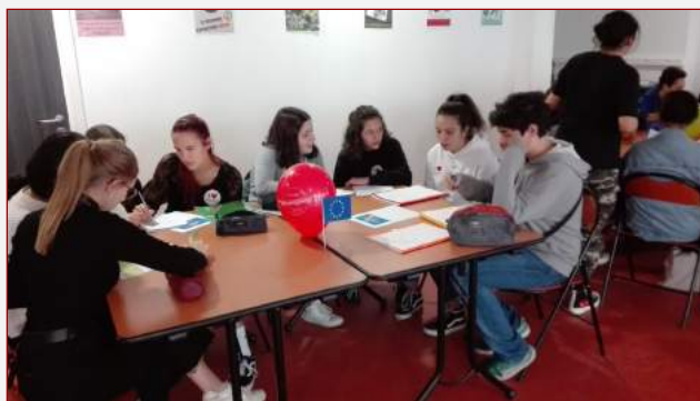
Activités Erasmus + de la SIE Strasbourg

Au collège, l'enseignante a envoyé de nombreux liens et du matériel pour les 6e, 5e et 4e. Les cours par visioconférence vont commencer dans les prochains jours. À l'école, Robert Schuman, les élèves de CM2, CP et CM2 ont reçu des consignes pour travailler avec leurs manuels et avec le matériel complémentaire qu'il leur a été fourni.