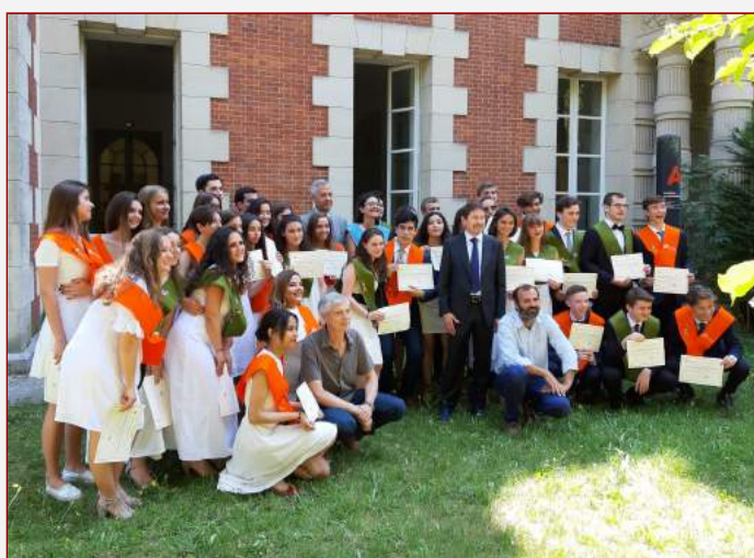
Remise des diplômes à la SIE Saint-Germain-en-Laye

Une chaîne audio a été activée sur la plateforme DISCORD 25 pour la coordination entre les enseignants de la section. Elle est également utilisée avec le personnel d'administration embauché par l'APASELI, l'association des parents d'élèves.