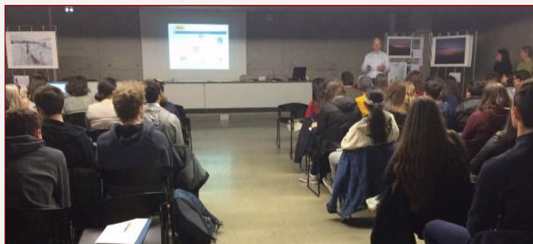
Conférence Étudier et se former en Espagne à la SIE de Lyon

L'équipe de la Section de Lyon maintient l'ensemble de son activité d'enseignement en suivant les orientations générales de l'administration française et les directives de l'Office pour l'Éducation de l'Ambassade d'Espagne. Des dispositifs et stratégies individuels ont été mis en place pour garder le contact avec les élèves.