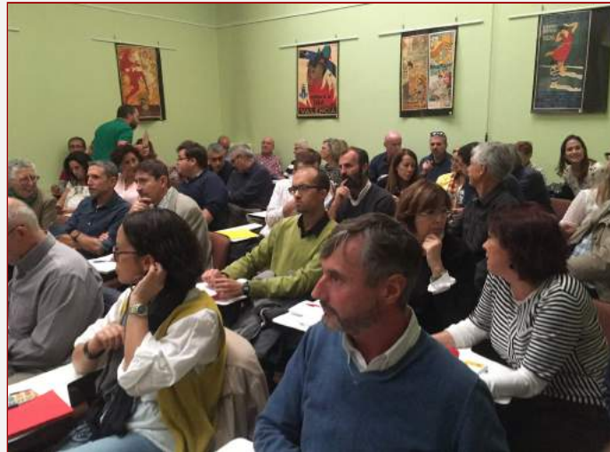
Le personnel enseignant des SIE lors de la réunion annuelle