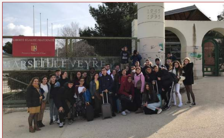
La SIE de Marseille dit au revoir aux élèves espagnols

Un travail important est mené pour reporter les voyages et les activités prévues, comme le voyage en Espagne de 3 e . Les outils utilisés pour communiquer avec les élèves sont surtout Pronote et le courrier électronique.