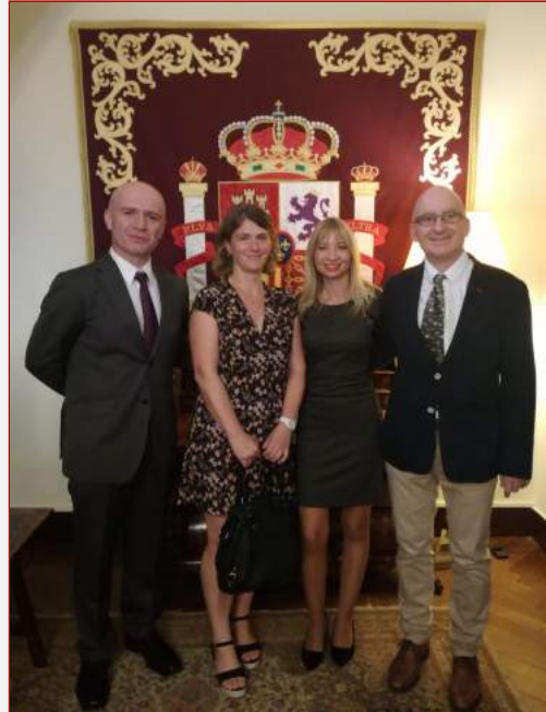
Les professeurs de la SIE de Saint-Jean-de-Luz-Hendaye

À l'École de la Plage, l'enseignante de la section a créé un mur de Padlet 8 pour chaque niveau, CE2, CM1, CM2. Le choix de cette plateforme répond au souci de sauvegarder la vie privée numérique des plus jeunes, mais aussi du fait de son de format attractif.