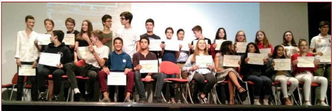
Remise de diplômes à la SIE de Valbonne-Nice

Les enseignants se sont coordonnés et suivent les indications du proviseur du Centre International de Valbonne: la plateforme prioritaire de communication avec les élèves est Pronote et l'attention aux élèves est assurée aux mêmes horaires que les cours présentiels.