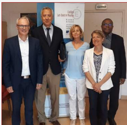
Visite du Conseiller pour l'Éducation à la SIE de Brest

La section utilise les plateformes Pronote, Toutatice, Educ'Horus et Pearltrees 2 pour assurer le lien avec ses élèves et les familles, et pour participer aux conseils de classe. D'autres moyens plus rapides sont également employés pour répondre aux questions qui se posent, le téléphone, le courrier électronique et les groupes de WhatsApp.