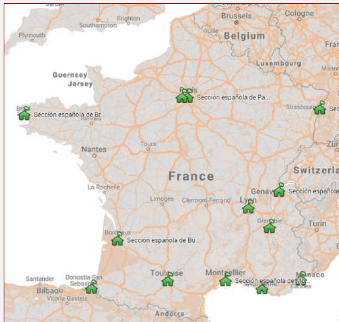
Carte interactive des SIE de Francia

Voyons, donc, les témoignages de nos treize sections en France, en commençant par Brest et en terminant par Saint-Germain-en-Laye.