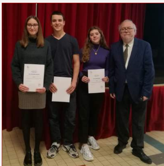
Concours d'éloquence à la SIE Paris

Concernant le matériel envoyé, l'objectif est de favoriser l'autonomie des élèves. Des guides de lecture des œuvres programmées sont en cours d'élaboration et d'autres supports sont en cours d'adaptation. Est également encouragée la remise d'exposés filmés et il a été proposé aux élèves la rédaction d' un journal du confinement .