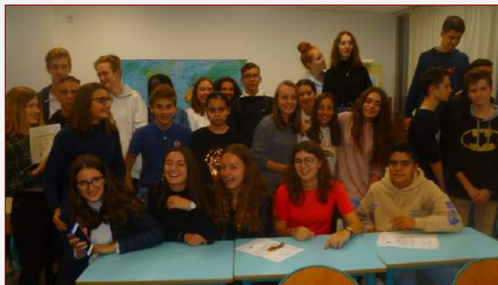
Des élèves de la SIE de Montpellier après la remise de diplômes

Lecture guidée de Don Juan Tenorio (LL) et étude du franquisme (HG) en 3 e ; activités de compréhension et d'expression (LL) et travaux de géographie démographique (HG) en 4 e ; la Renaissance (HG) et lecture guidée du Quichotte (LL) en 5 e , et climogrammes (HG) et exercices de composition et d'orthographe (LL) en 6 e .