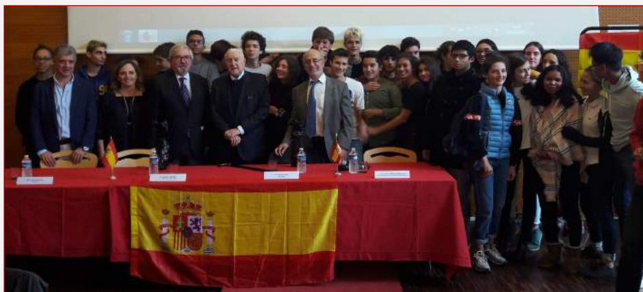
La SIE de Bordeaux à l'occasion d'une remise de diplômes

À l'école Paul Bert, c'est le courrier électronique qui a été adopté pour garder le lien avec les élèves. On poursuit le travail sur les thèmes d'apprentissage en cours : la famille (CE2), le quartier (CM1) et la nature (CM2).