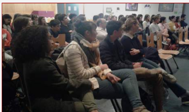
Conférence à la SIE de Grenoble

L'envoi, la réception et la correction des tâches se font par voie électronique. Des enregistrements audiovisuels avec des tutoriels sont également effectués, pour préparer notamment les épreuves orales de l'OIB.