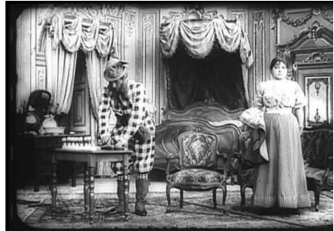
El hotel eléctrico (1908)