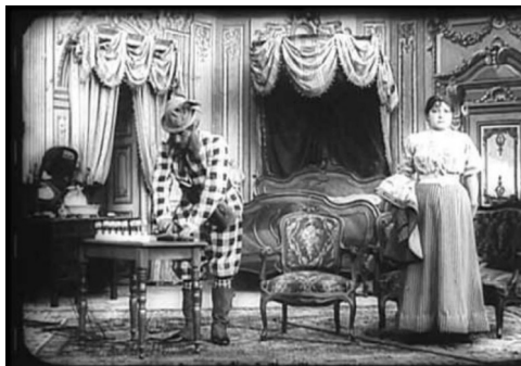
El hotel eléctrico (1908)