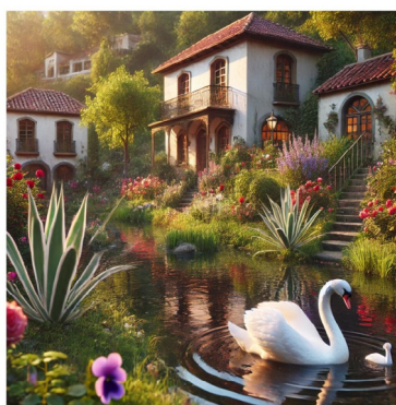
Imagen generada con DALL-E 3 tomando como referencia el fragmento del cuento En Chile

Vídeo generado con PIKA a partir de la im- gen creada con DALL-E 3