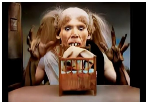
La casa embrujada (1907).