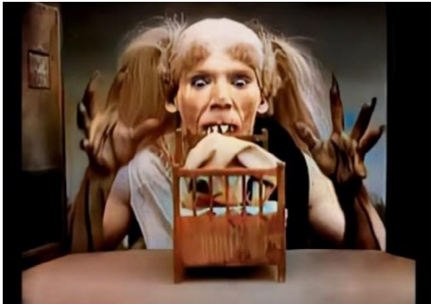
La casa embrujada (1907).

Creaba escenarios en miniatura para simular grandes espacios, castillos, ciudades o paisajes de forma económica y controlada. Contribuían a construir mundos fantásticos en pantalla.