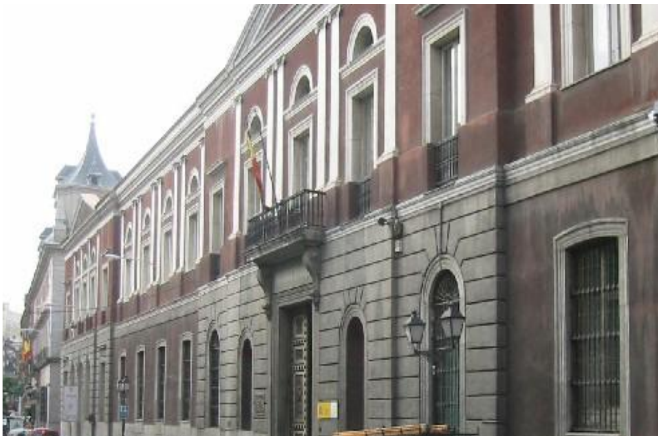
ANTRADA Y FACHADA PRINCIPAL DEL CEE ANTIGUA UNIVERSIDAD CENTRAL EN SAN BERNARDO 49 (MADRID)

El arquitecto transforma la planta de cruz latina de la iglesia, en una elipse similar a la del Senado. La inauguración oficial del Paraninfo se hizo sin terminar el lucernario en el curso 1854-1855, y a la que asistieron los reyes, Isabel II y Francisco de Asís.