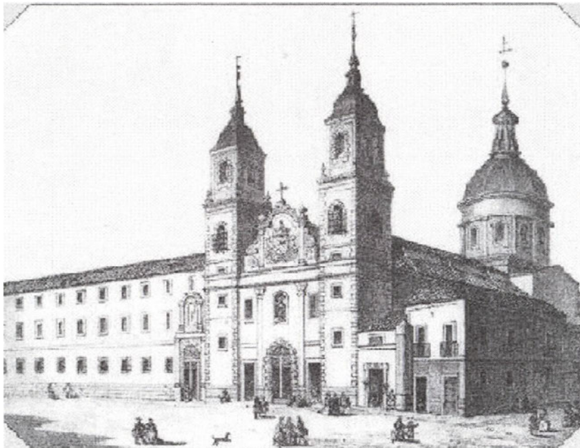
CONVENTO DE LOS JESUITAS

do, comprando a sus 17 propietarios, (el dueño había dividido su propiedad entre 17 herederos), una finca situada en la calle Ancha de San Bernardo. En esta finca había estado la Embajada de Génova, quedando abandonada igual que muchos otros edificios de la ciudad, al trasladarse la Corte de Madrid a Valladolid en 1601 durante cinco años, en tiempos de Felipe III, por presiones de su valido el Duque de Lema.