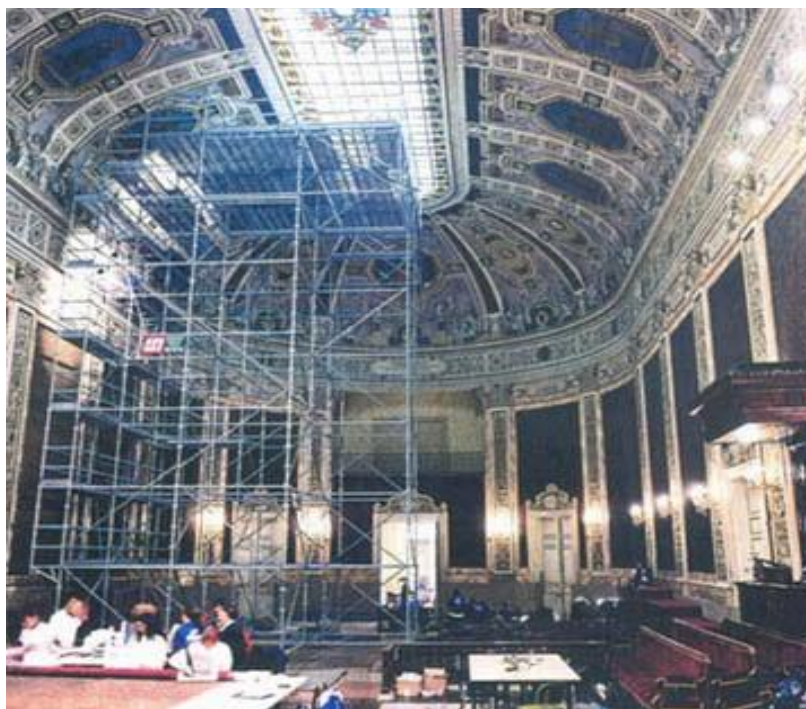
RESTAURACIÓN DEL PARANINFO DE LA U. COMPLUTENSE

También en ese mismo año, se le encarga a Francisco Jareño, arquitecto del Ministerio de Fomento, la ampliación y fachada, de lo que hoy es únicamente el Instituto del Cardenal Cisneros, pero que en aquella época estaba ocupado por la facultad de