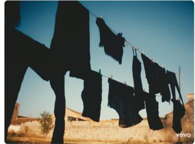
C. Tangana - Demasiadas Mujeres (Video Oficial)