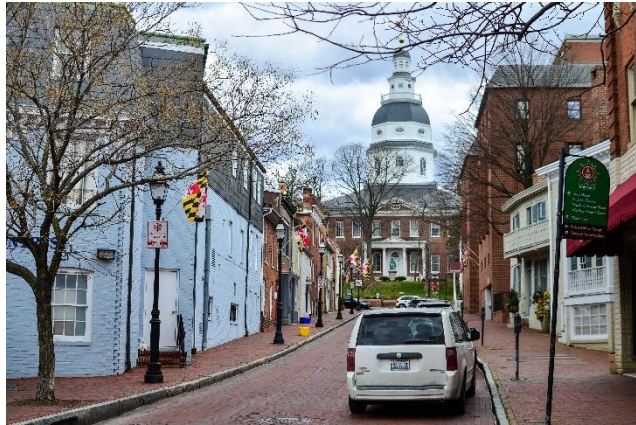
"Annapolis, MD"

Maryland, una de las trece colonias originales de los Estados Unidos, es el noveno estado más pequeño del país. Bañada por la bahía de Chesapeake, Maryland hace frontera con Pensilvania en el norte, Virginia y Virginia Occidental al oeste, Delaware al este y Washington DC al sur. La capital del estado es Annapolis, una pequeña ciudad de unos 40.000 habitantes, en la que destacan su arquitectura colonial y su rica historia marítima.