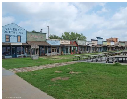
Dodge City (suroeste de Kansas)