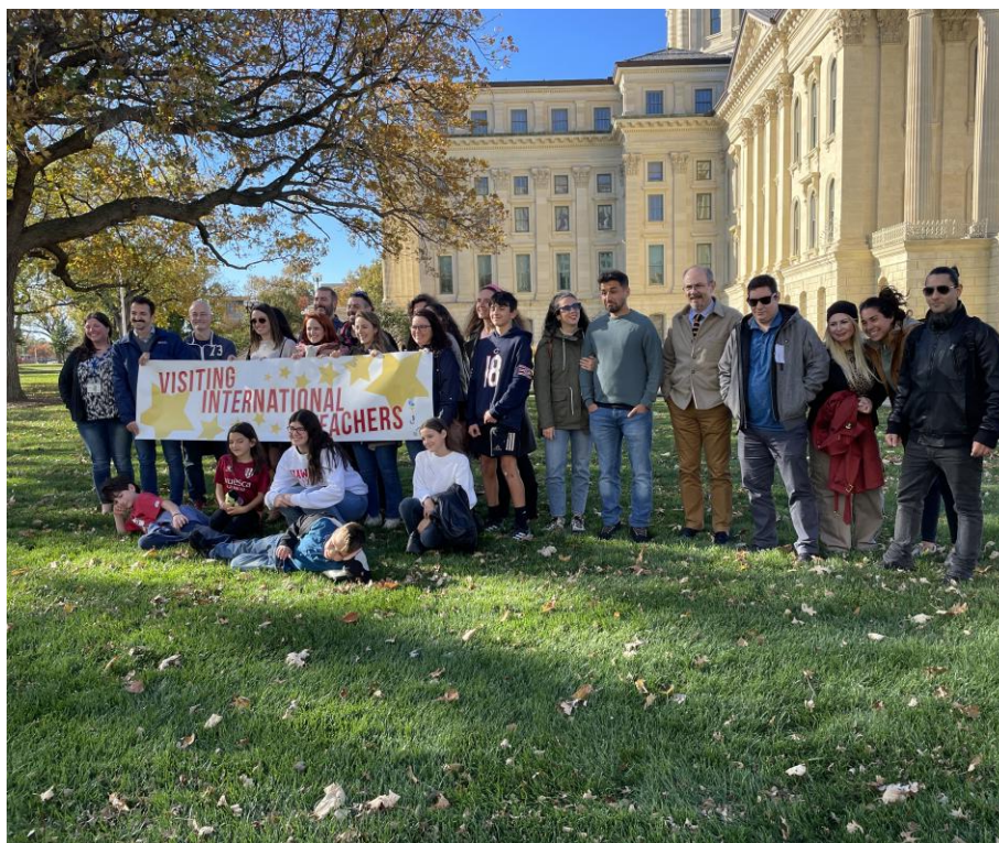
Figure 1 Grupo de PPVV en Kansas 2024