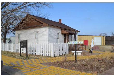
Dorothy's House & The Land of Oz