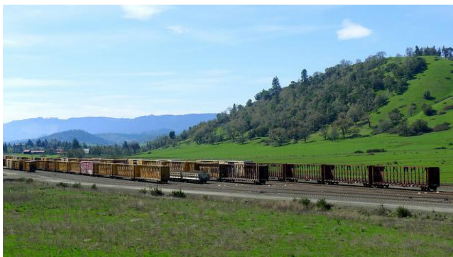
Oregon Trail en Kansas

Durante el siglo XIX, Kansas fue zona de paso de las migraciones hacia el oeste, el Oregon trail , y hacia el suroeste, el Santa Fe Trail . En los prolegómenos de la guerra civil, Kansas fue escenario de sangrientas luchas entre abolicionistas y esclavistas. En 1861 se convirtió en el estado número 34 de la Unión. Tras la guerra civil se produjo la expansión hacia el oeste con la construcción de líneas de ferrocarril, el desalojo de las tribus nativas, la caza indiscriminada de millones de búfalos y el traslado masivo de ganado vacuno o Cattle Drives desde Texas a través del Chisholm Trail a sus legendarias Cow Towns del Wild, Wild West como Abilene o Dodge City.