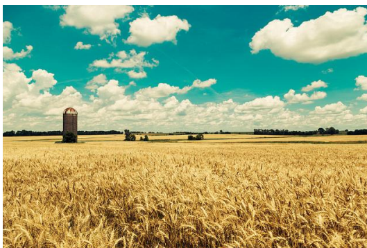
Campo de trigo en Kansas

Kansas es el principal productor de trigo de los EE. UU. con una quinta parte de su producción nacional, cultivándose principalmente en el centro y oeste del estado. También es destacable su producción de maíz y de ganado vacuno. En cuanto a su producción industrial hay que mencionar sus industrias cárnicas ( meat packing plants ) e industria aeronáutica concentrada principalmente en Wichita.