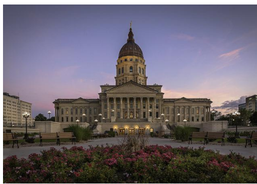
Capitolio del estado de Kansas situado en su capital, Topeka

Sus principales núcleos de población se concentran en el este del estado, siendo su ciudad más poblada Wichita, con una zona metropolitana de aproximadamente 396.192. Kansas City es una ciudad de gran pujanza industrial, tiene casi 663.000 de habitantes, si añadimos la zona urbana de Kansas City, en Missouri, a la parte de la ciudad que se encuentra en el estado de Kansas. La capital del estado es Topeka con unas 130.000 personas, también situada en la parte este del estado. Debemos destacar también las ciudades universitarias de Lawrence, Manhattan y Emporia. En la zona suroeste podemos mencionar las legendarias Dodge City y Garden City. Hay que distinguir, pues, entre la zona este, poblada e industrial y la zona centro y oeste, poco habitada y eminentemente agrícola y ganadera.