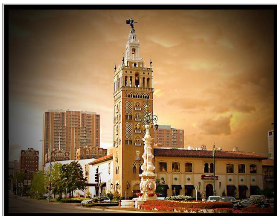
Réplica de La Giralda en el barrio de The Plaza, Kansas City