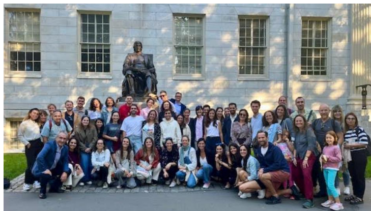
PPVV en el Harvard Yard. Jornada de bienvenida 2025. Cambridge MA.

El programa de profesorado visitante comenzó en Massachusetts en el curso 1999-2000, con una experiencia piloto fruto del acuerdo entre el Ministerio de Educación y Formación Profesional de España y el Departamento de Educación de Massachusetts. Desde entonces más de 300 PPVV han pasado por las aulas de este estado. Durante el curso 2025/26 un total de 14 distritos escolares y 41 centros escolares acogen a 121 PPVV.