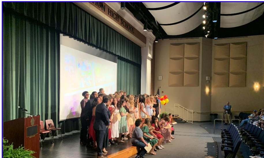
Bryan Station High School. Graduación grupo de Inmersión.