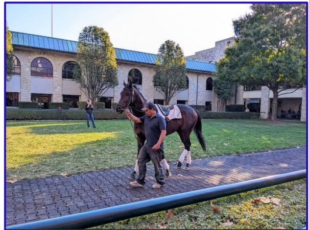
Lexington Horse Capital of the World