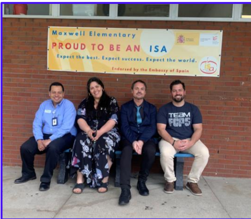
Maxwell Elementary Spanish Immersion