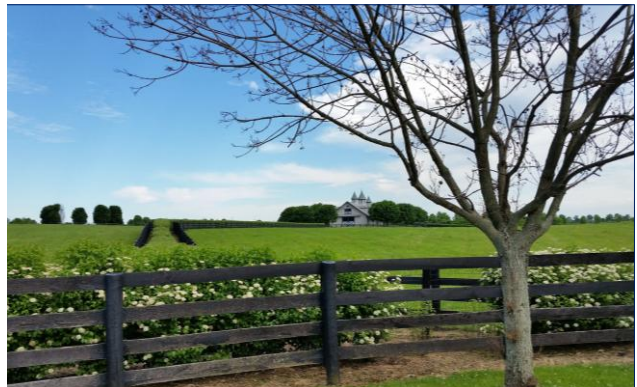
Granja de caballos en Lexington, KY

Email: agregaduria.newyork@educacion.gob.es