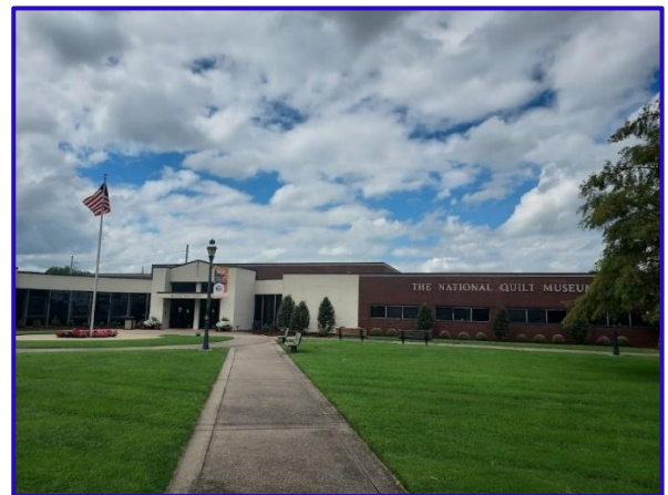
The National Quilt Museum (Paducah)

Kentucky es el segundo estado con más millas de agua corriente en todo Estados Unidos, con un total de 1.100 millas, equivalentes a 1.770 kilómetros. Además, Kentucky posee más de 12.7 millones de acres en áreas forestales, equivalentes a más de 5 millones de hectáreas. La gran variedad y cantidad de recursos naturales hacen de Kentucky un estado muy atractivo para diferentes sectores de la industria y comercio, tanto nacionales como internacionales. Los mayores sectores industriales del estado se reparten entre los relacionados a la aeronáutica, la automoción, la biotecnología, los productos químicos, la alimentación (comida y bebida), la sanidad, los productos manufacturados, las materias primas, el transporte, los deportes y el turismo.