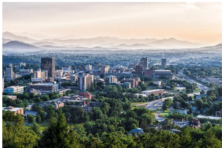
"City of Asheville, North Carolina" by Ken Lane is licensed under CC BY-NC-SA 2.0

Carolina del Norte limita con los estados de Carolina del Sur, Georgia, Tennessee y Virginia, ocupando una superficie aproximada de 132.000 kilómetros cuadrados.