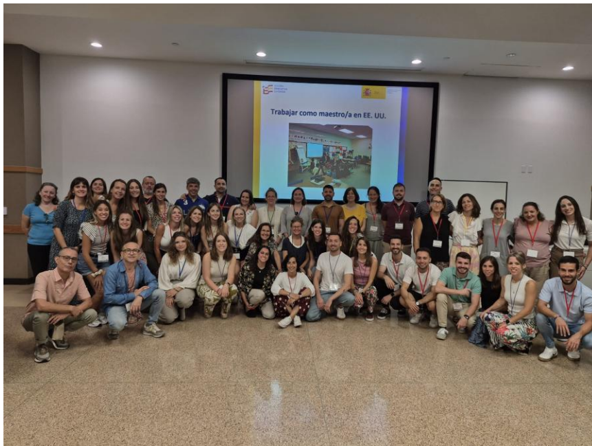
Acogida Profesorado Visitante en Austin

El Programa de Profesorado Visitante se desarrolla de conformidad con el Memorándum de Entendimiento firmado por la Agencia de Educación de Texas, el Consejo Estatal para la Certificación de Educadores de Texas y el Ministerio de Educación, Formación Profesional y Deportes.