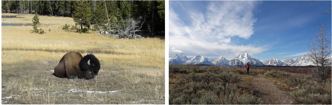
De izquierda a derecha, Yellowstone National Park y Grand Teton National Park

Hay también estaciones de esquí cerca de Wyoming, en los estados de Colorado, Utah, Montana y Dakota del Sur.