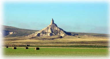
Chimney Rock, en el oeste de Nebraska

El estado de Nebraska ofrece diversos atractivos que debemos de conocer. En primer lugar, hay que mencionar las denominadas Sandhills , un extenso y sobrecogedor mar de pradera arenosa, único en el mundo que constituye la mayor extensión de dunas estables en el mundo.