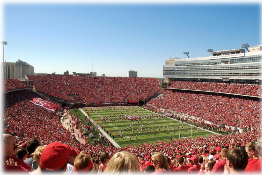
Memorial Stadium en un día de partido

Schyler. Destaca la zona sur de Omaha como la más poblada por hispanos, en su mayoría de origen mejicano. La mayor parte de la inmigración europea durante la colonización de Nebraska provenía de países de Europa Central, especialmente la antigua Checoslovaquia y Alemania.