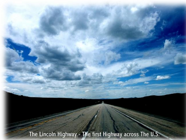
La primera carretera transcontinental: Lincoln Highway

También cabe destacar, en el siglo XX, el paso por Nebraska de la histórica Lincoln Highway , la primera carretera transcontinental, así como la autopista interestatal I-80, verdadera columna vertebral del estado, que une Nueva York con San Francisco. También es importante mencionar que Nebraska es el único estado unicameral, es decir, con una sola cámara legislativa.