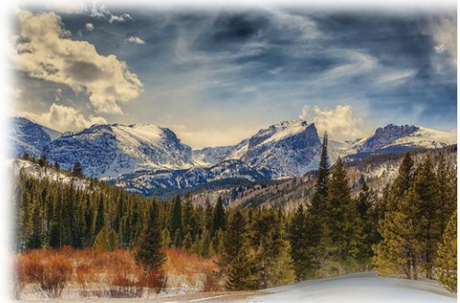
Montañas rocosas en Colorado