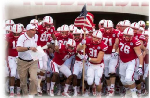
Los Huskers, equipo universitario de fútbol americano de Nebraska