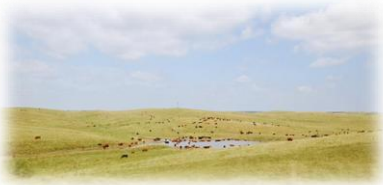
Sandhills, localizadas en el centro-norte de Nebraska