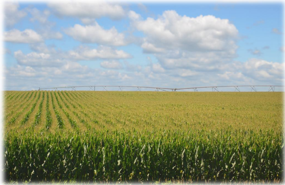
Campo de maíz en Nebraska

Omaha es sede de empresas tan importantes como Union Pacific (transporte ferroviario), Omaha Mutual (seguros) o Gallup (estudios sociológicos). Originario de Omaha, desde donde dirige sus empresas, es el inversor Warren Buffet, poseedor de una de las grandes fortunas de los EE. UU. Como dato interesante también podemos señalar que muchas empresas de telemarketing tienen su sede en Omaha debido al acento neutral y poco marcado de los habitantes de Nebraska. El coste de la vida en Nebraska se encuentra por debajo de la media del país. Este estado se encuentra entre los puestos más altos del Morgan Quitno's Most Livable States Ranking , que evalúa y clasifica la calidad de vida de los 50 estados americanos.