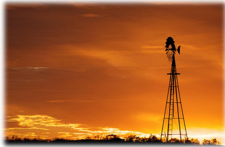
Atardecer en Nebraska

El clima de Nebraska es continental seco y extremo, con enormes variaciones entre el verano y el invierno. Debemos venir preparados para un frío intenso durante los meses de diciembre, enero y febrero y un fuerte calor húmedo entre junio y septiembre. Durante los meses de primavera y otoño, las temperaturas suelen ser agradables si bien podemos encontrarnos con fuertes oscilaciones y además con tormentas. Los habitantes de Nebraska suelen decir que «si no te gusta el tiempo, espera cinco minutos y cambiará».