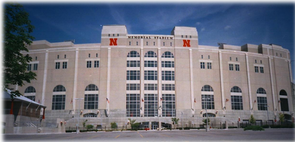
Entrada principal del Memorial Stadium