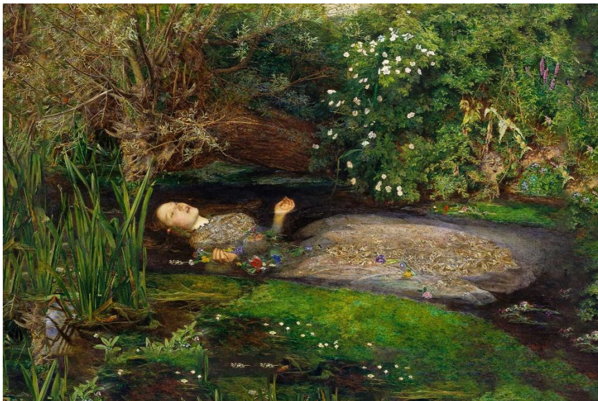
Ophelia - John Everett Millais

Ambas mujeres cambian completamente la vida de los protagonistas. Fernando abandona sus responsabilidades y se obsesiona con el espíritu misterioso, Janko arriesga su vida para salvar a la virgen.