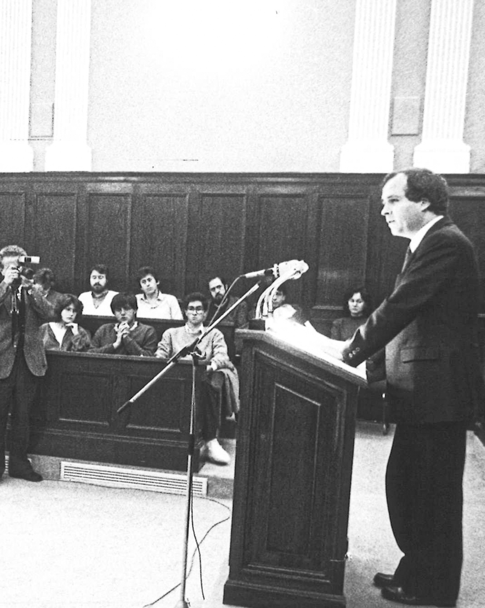
JOSÉ MARÍA MARAVALL, MINISTRO DE EDUCACIÓN Y CIENCIA, DIRIGIÉNDOSE A LOS CONSEJEROS Y CONSEJERAS EN EL SALÓN DE PLENOS DEL CONSEJO ESCOLAR DEL ESTADO.