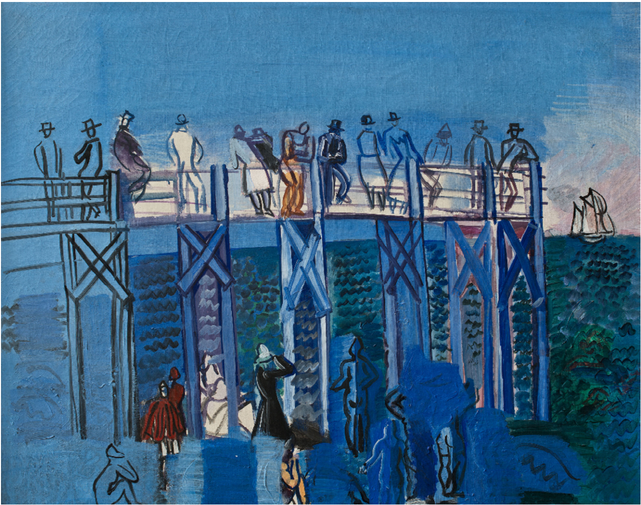
Raoul Dufy (1926). El muelle y la playa en Le Havre © Raoul Dufy, VEGAP, Madrid, 2016. Musée d'art moderne André Malraux, Le Havre.

por solo mencionar algunos de los señalados más reiteradamente, se encuentra el lenguaje utilizado en el hogar, el ambiente afectivo de la familia, las estrategias de disciplina y control utilizadas por los padres o las creencias de estos sobre el aprendizaje (Hess y HOLLOWAY, 1984; REDDING [et al.], 2004). Los estudios han puesto de manifiesto, además, que no es posible encontrar un único elemento en el que resida la clave de un adecuado desarrollo infantil, sino que resulta necesario comprender la interacción entre diferentes factores y considerar su carácter dinámico y cambiante, así como su dependencia del contexto social en el que se inscriben.