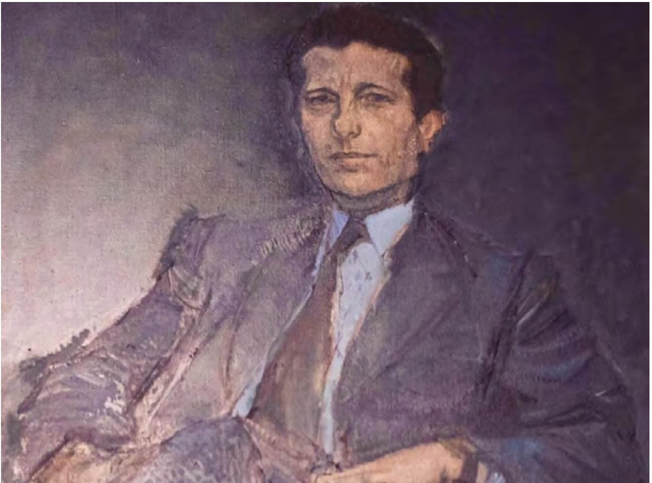
Federico Mayor Zaragoza Galería de retratos de ministros de Educación