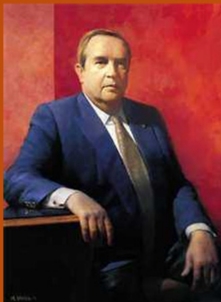
cartela: Jerónimo Saavedra Acevedo / 1995-1996 autor: Miguel Arocha Isidro fecha de la pintura: 1996

Ministro de Educación y Ciencia, 2-julio-1995 a 6-mayo-1996