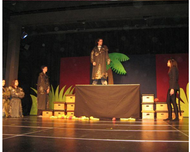
Obras de teatro