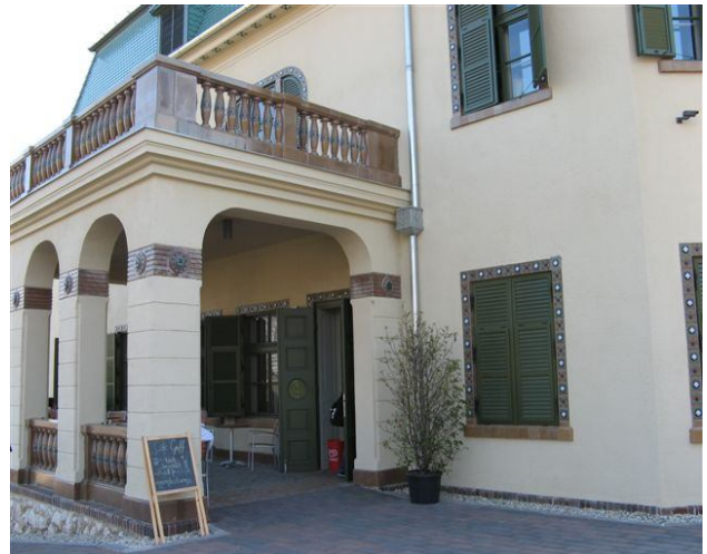
Teatro de Marionetas de Pécs