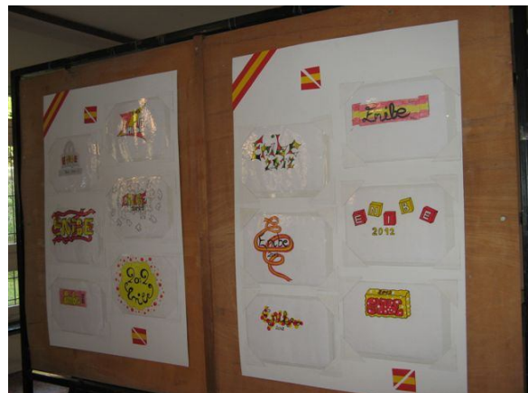
Dibujos de los alumnos