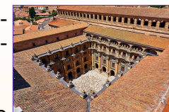
Universidad de Salamanca

Las universidades españolas están abiertas a los estudiantes extranjeros.