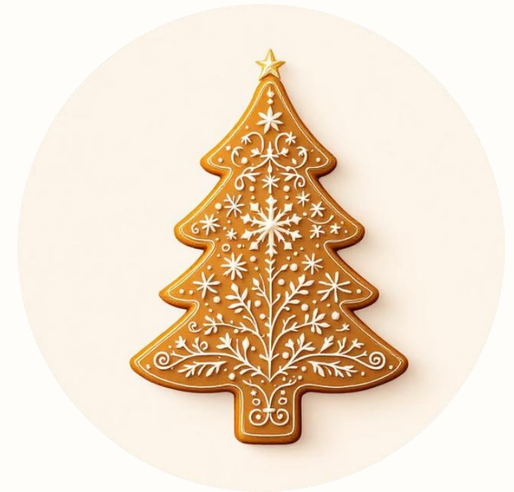
3. Galleta de jengibre