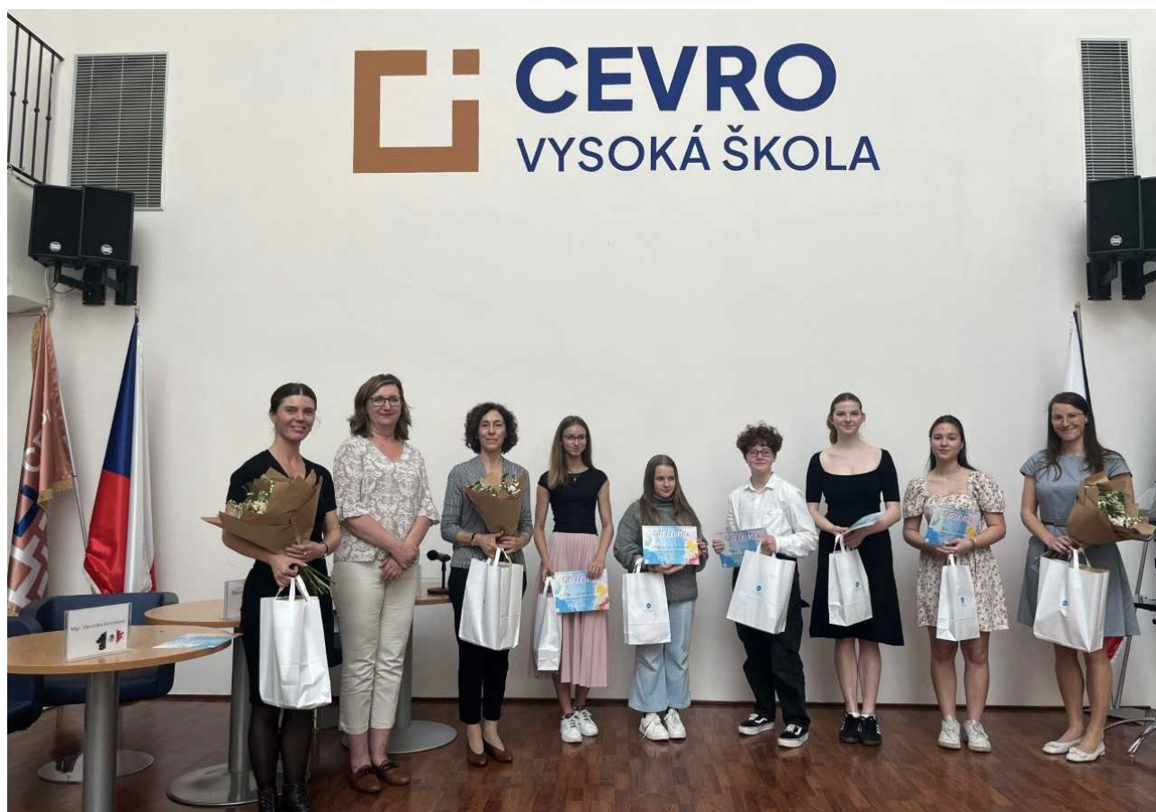
Předávání cen vítězům literární soutěže "Slovy básníka"

Vzhledem ke stále vzrůstajícímu zájmu o španělský jazyk je možné také neustále rozšiřovat repertoár programů a aktivit zaměřených na studenty i vyučující, které Oddělení vzdělávání každoročně realizuje ve spolupráci s různými institucemi. Studentům španělštiny na českých středních školách i dvojjazyčných gymnáziích nabízí Oddělení vzdělávání ve spolupráci s různými sponzory celou škálu soutěží, v nichž mohou žáci předvést své dovednosti i zanlosti španělštiny. Jsou to například Soutěž matematické fotografie , Soutěž krátkometrážních filmů ve španělštině a pěvecká soutěž ¡Canta en español!