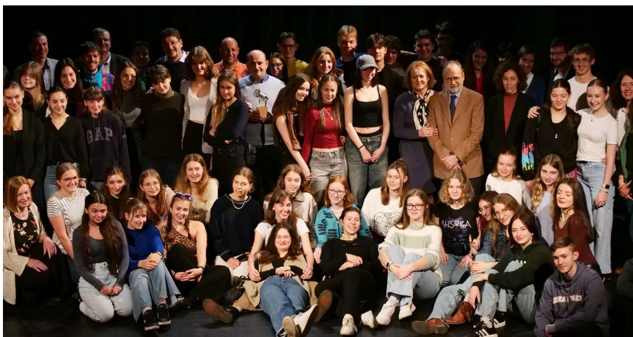
Festival školního divadla ve španělštině v Praze 2024

Nejdůležitější kulturní aktivitou je pořádání Národního festivalu školního divadla ve španělštině, kterého se účastní všechny bilingvní sekce se svými divadelními skupinami. Festival, který se každoročně koná v jiném městě, se stal stabilním bodem setkání školní komunity a propagace španělského jazyka a kultury. V roce 2024 se XIV. ročník konal v Praze.