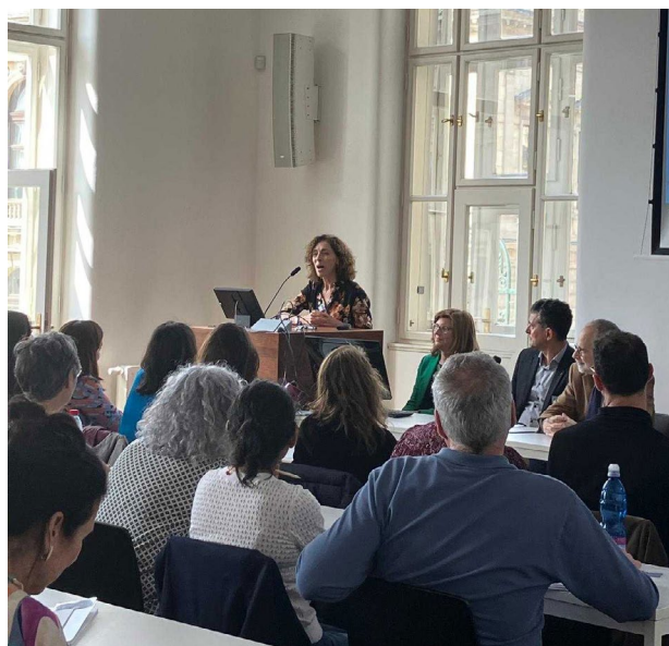
Workshop pro učitele španělštiny PragueELE V

Vzdělávací činnost v zahraničí je přítomna v českých institucích a na univerzitách, kde se vyučuje španělština, prostřednictvím účasti Přidělenkyně pro vzdělávání na různých akcích souvisejících se španělštinou, které organizuje Oddělení vzdělávání, velvyslanectví nebo sektorové kanceláře ambasády, vzdělávací instituce nebo sami vyučující. Mezi tyto akce patří například soutěže v recitaci poezie a prezentacích ve španělštině, národní olympiády ve španělském jazyce a kultuře, Dny španělštiny na základních, středních školách a univerzitách, gastronomické dny na středních odborných školách v oblasti pohostinství v České republice a další.